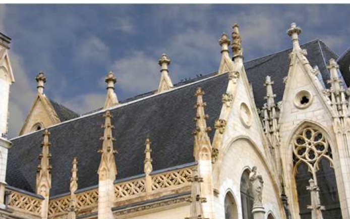
Couverture en ardoise - Eglise Saint-Martin à Roubaix