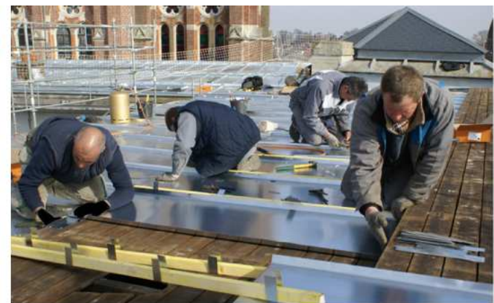
Toiture en zinc à ressaut - Bureau de poste à Caudry