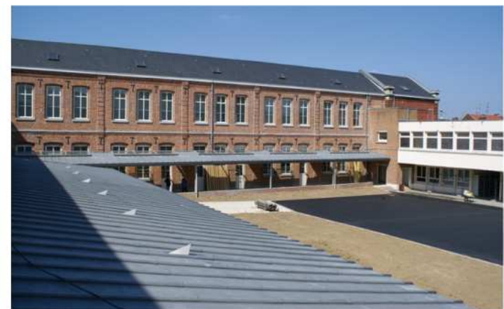
Travaux patrimoniaux et de reconstruction - Lycée Paul Hazard à Armentières