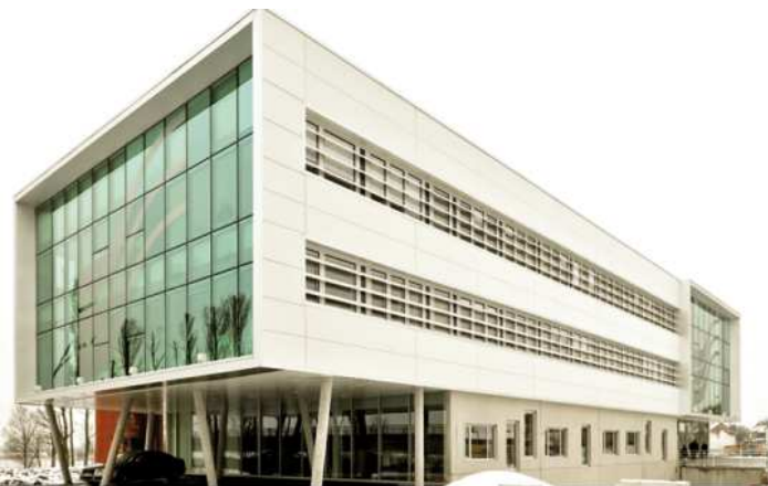
Bardage zinc et bois - Siège social Ramery à Erquinghem-Lys