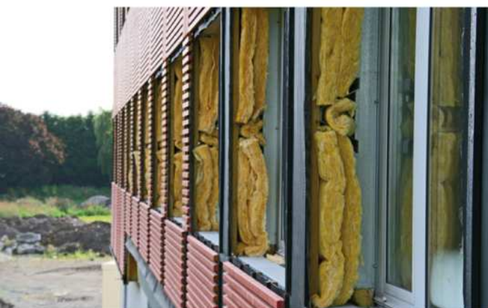
Isolation par l'extérieur et bardage bois - Siège social Ramery à Erquinghem-Lys