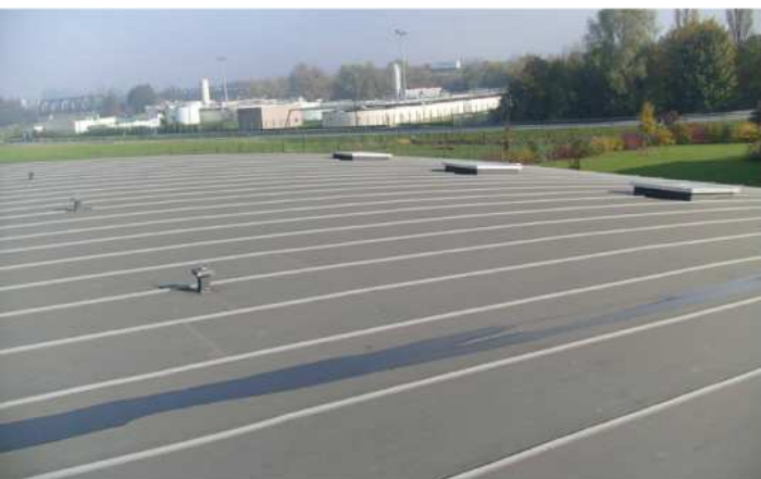
Étanchéité à joint debout - SIZIAF à Douvrin