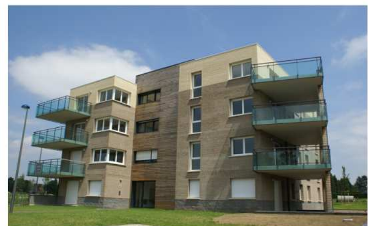
Bardage bois - Logements sociaux à Hem