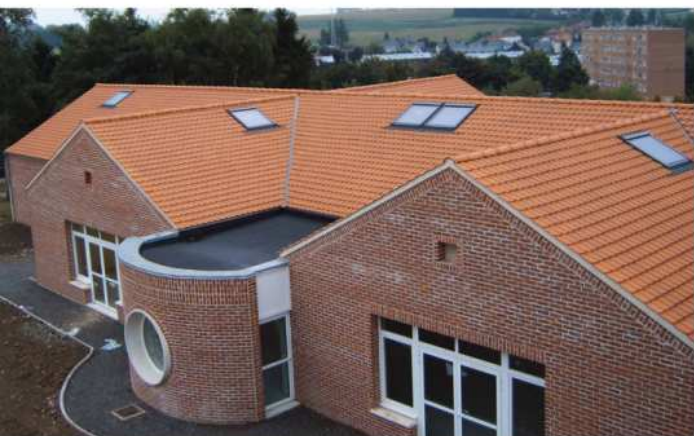
Couverture en tuile - Groupe scolaire Mespreuven-Paul Eluard à Louvroil